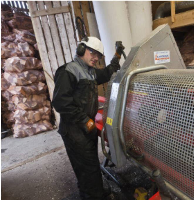
Ved kappes og klargjøres ved Storeholmen.