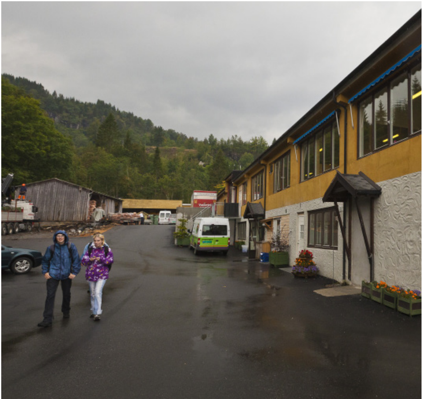
Den vernede bedriften Storeholmen ligger midt i Øystese.