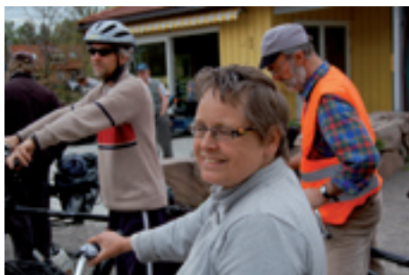
Klar for sykkelturn til Kodal.