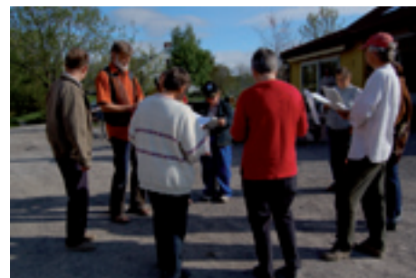
Morgensamling med sang før dagens arbeid.

Det viktigste med arbeidet sett gjennom Camphill-filosofien er at hver enkelt gjør noe som noen andre trenger, enten det er behov i landsbyen som må dekkes eller det er noen i det store samfunnet som vil ha gode leker eller vakker keramikk. Alle i