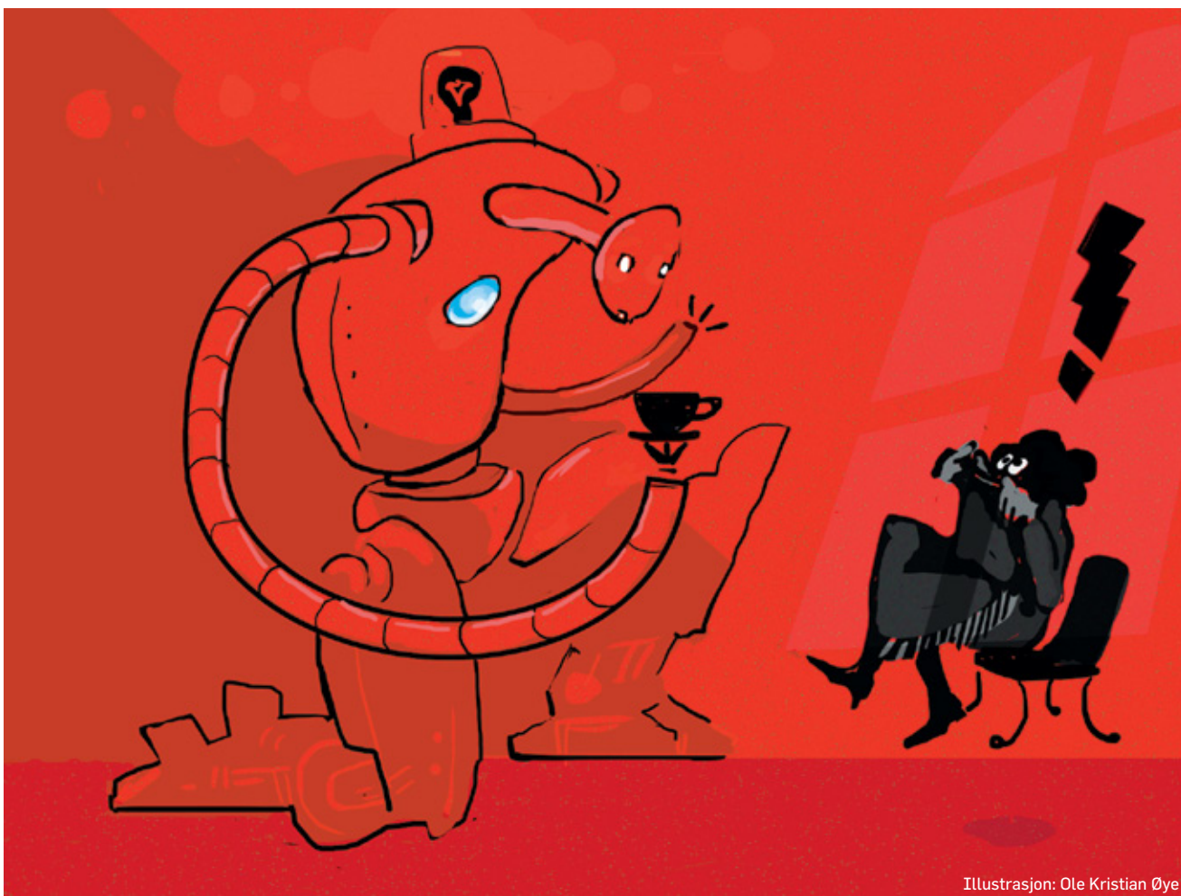
Illustrasjon: Ole Kristian Øye