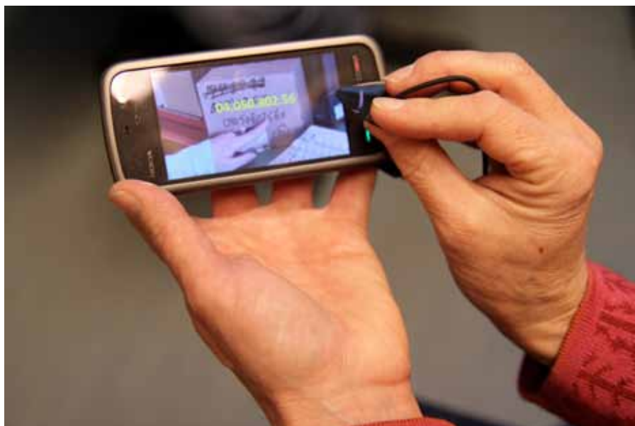
HUSKELAPP: Håndholdte instruksjonsfilmer, skal gjøre det enklere å repetere og huske nye arbeidsoppgaver.