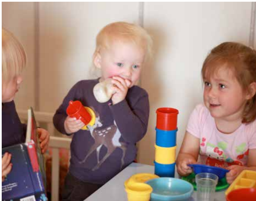
I kjøkkenkroken på Brannhaugen barnehage. Her skapes gode grunnpilarer for videre vennskap