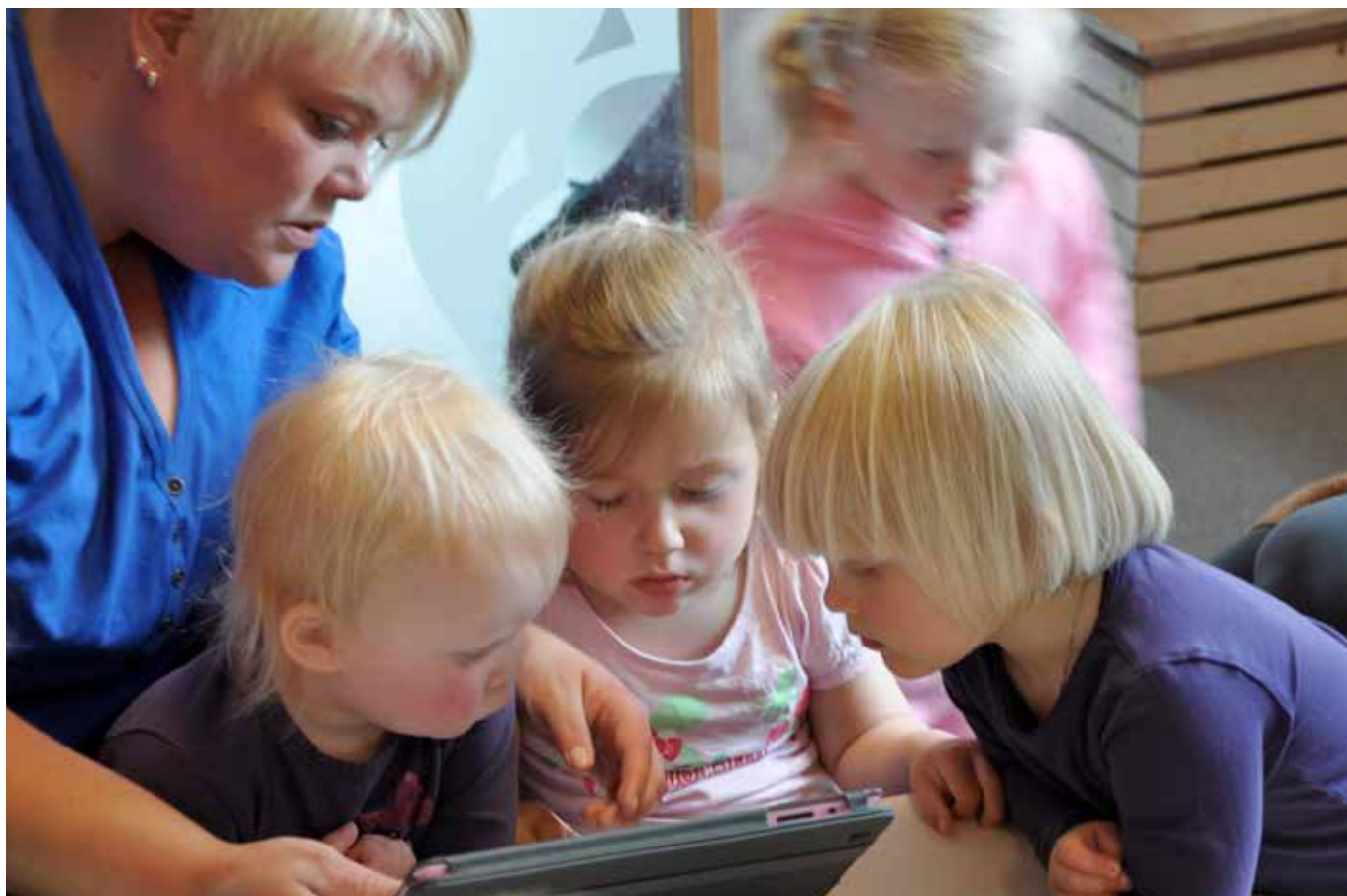
Nora har «tjuvtrent» på Ipaden, og de andre barna er mer enn villige til å lære nye spill

TEKST: Kristin E. Giæver