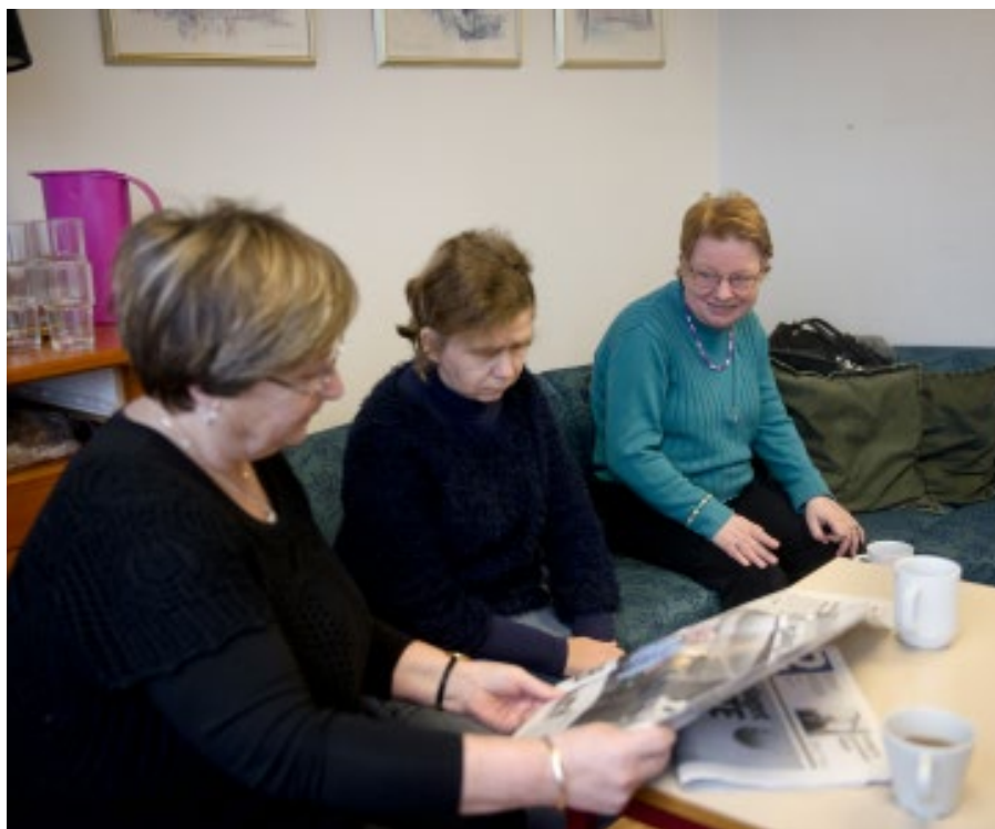
ROLIG MORGEN: Seniortreffene skal være en hyggelig sammenkomst fri for stress.