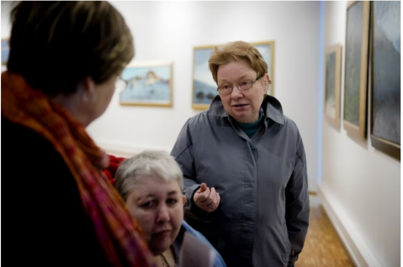
GODE OPPLEVELSER: Seniortreffene er en slags blanding av seniorsenter og seniorklubb. Rolige inneaktiviteter kombineres med utflukter.

på konserter, teater og turer og vi bruker kulturtilbudet i nærmiljøet aktivt.