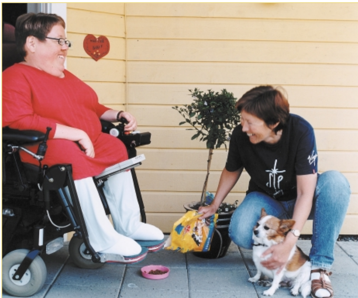
Fido må også ha mat