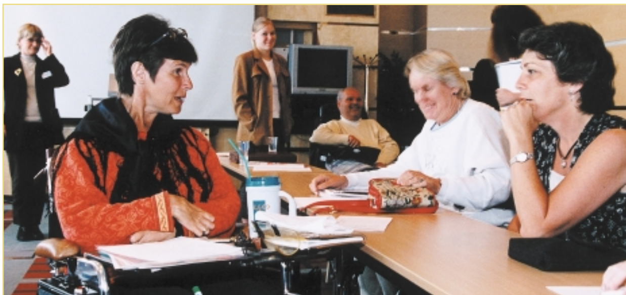
Ansatte ved RO holder i samarbeid med erfarne arbeidsledere i ULOba, kurs for arbeidsledere og assistenter.