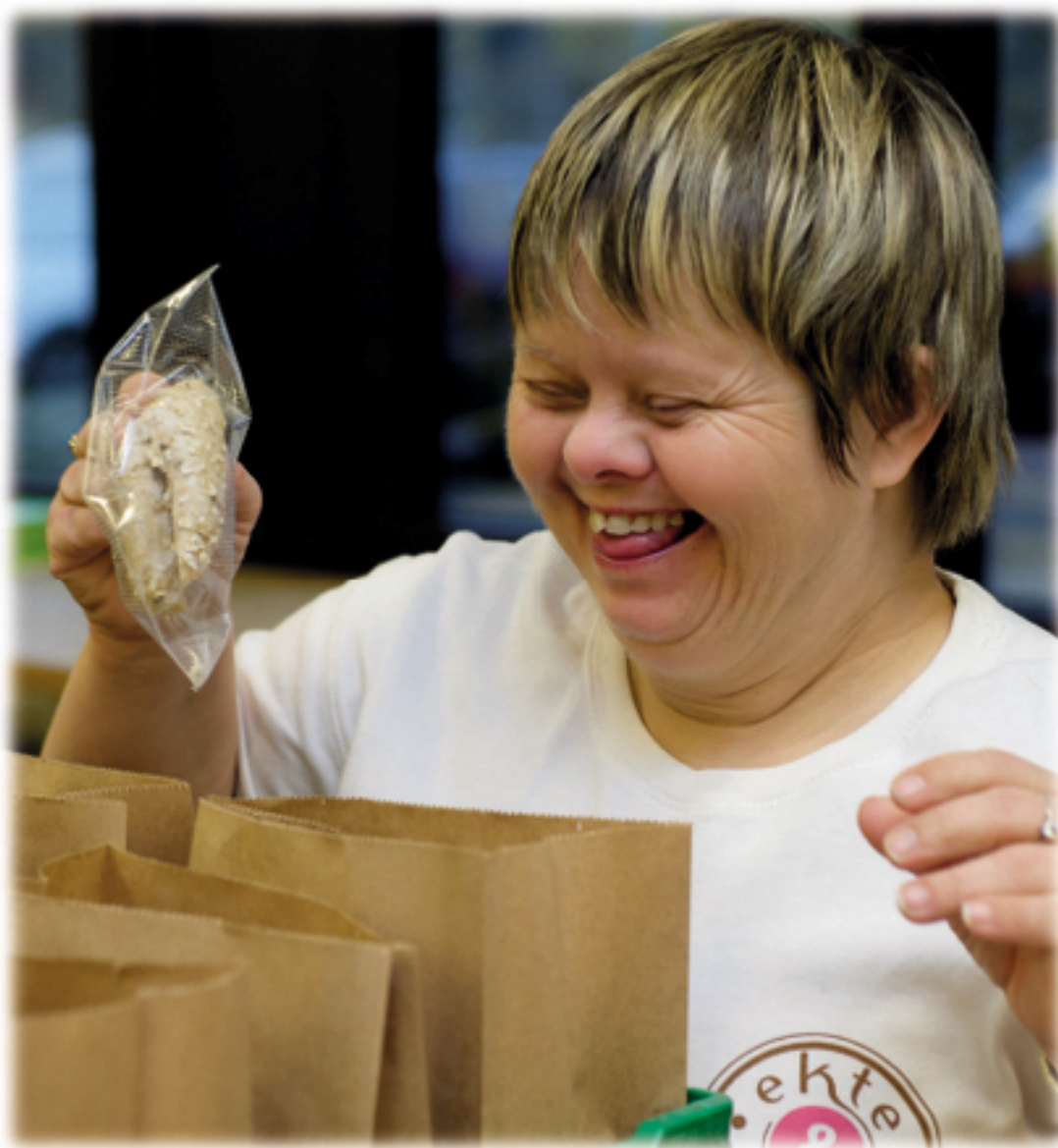
Asker Produkt 2012